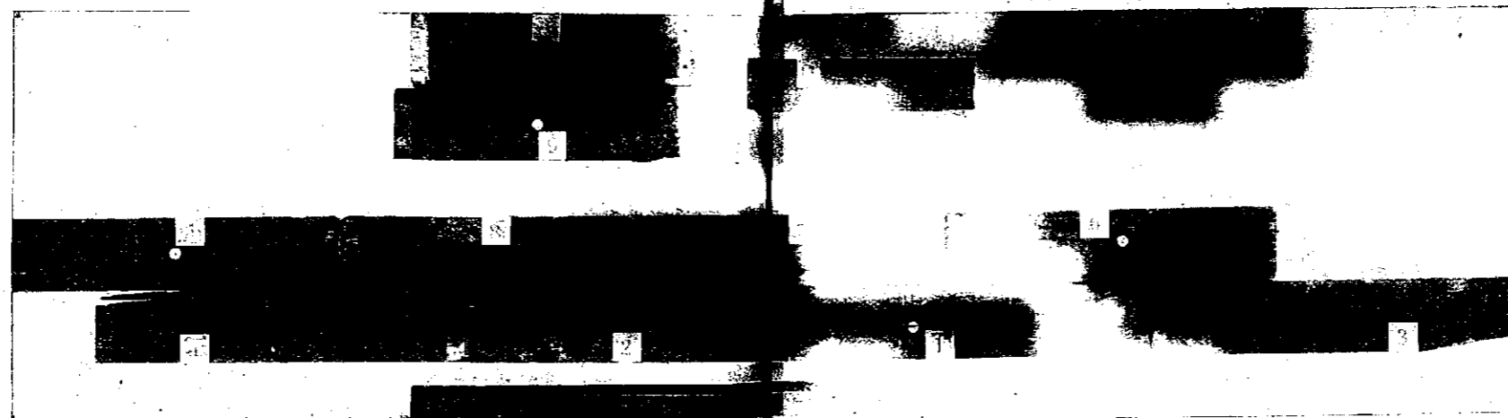
FIG. 2 : huit marches (échelons) de l'échelle provenant d'une même branche (pin de la Caroline du Nord). Une scie à main avait servi à les découper. Les autres marches (échelons) proviennent de bois « Douglas fir ».